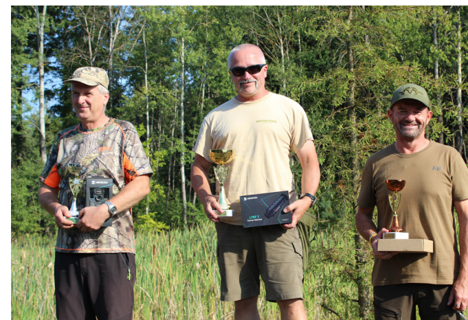
Tři nejlepší v kategorii Senioři