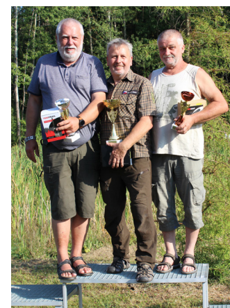
Tři nejlepší v kategorii Veteráni