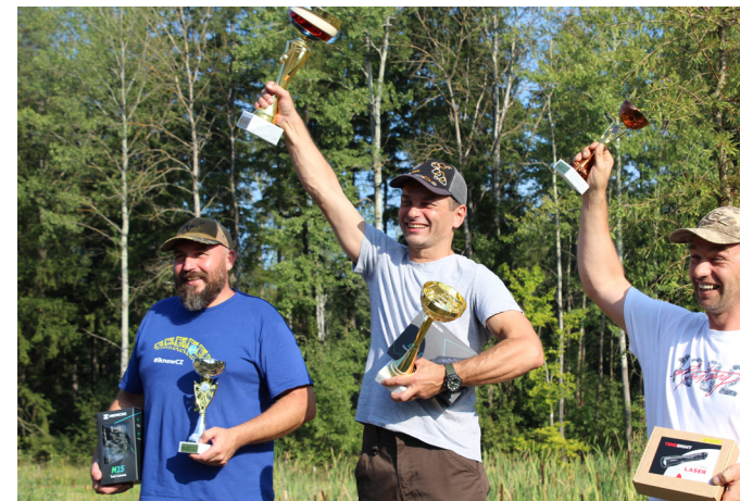
Tři nejlepší v absolutním pořadí i v kategorii Muži

Třešničkou na dortu, na kterou všichni přítomní netrpělivě čekali, bylo vylosování hlavní ceny TENOLIX. Do losování byli zařazeni všichni střel-