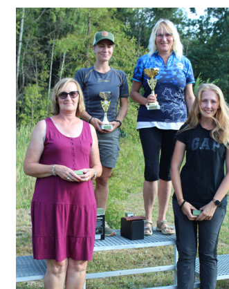
Nejlepší v kategorii Ženy