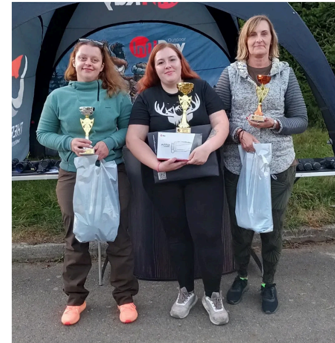
Tři nejlepší v kategorii Ženy