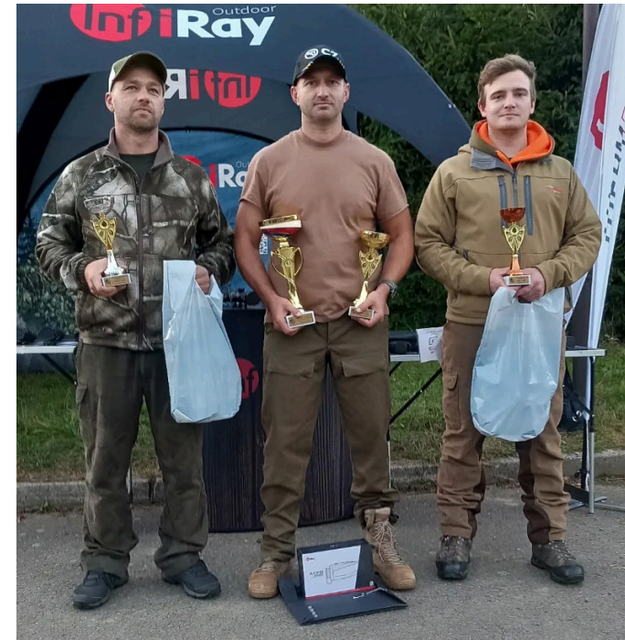
Tři nejlepší v kategorii Muži

V kategorii SENIORŮ od 50 do 59 let se utkalo o titul devět závod-