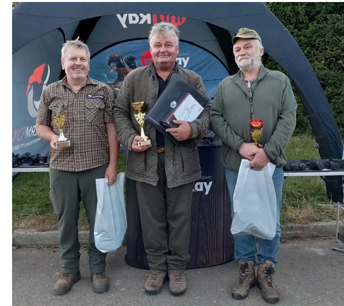
Tři nejlepší v kategorii veteráni