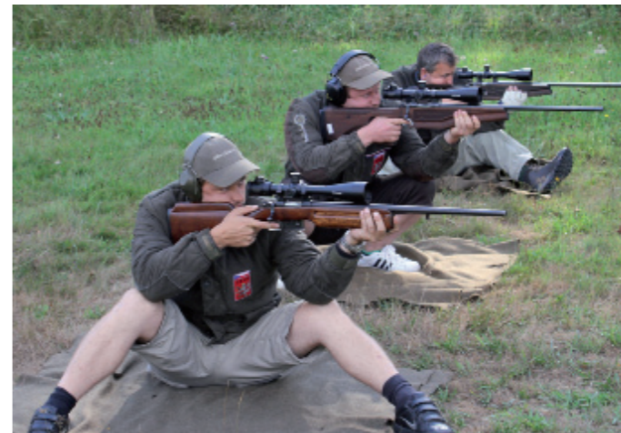
Nejúspěšnější družstvo CK Velma v akci