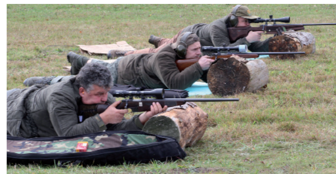
Nejllepší družstvo při VC Vysočiny v akci