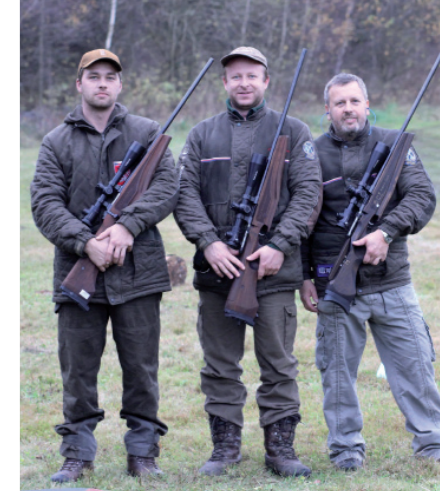
Nejúspěšnější družstvo terénního střelení

A jak dopadl seriál celkově? Letos se hodnotila nejlepší tři dosažená