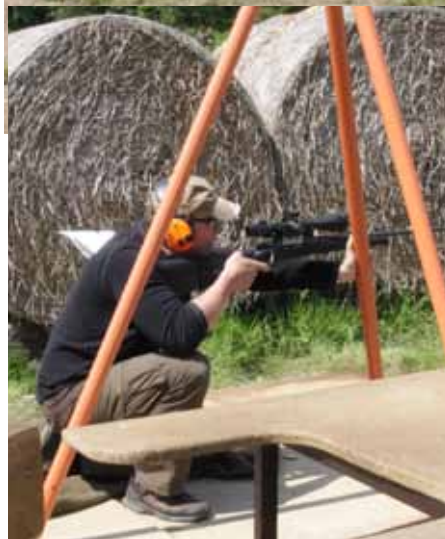
Vysoká trojnožka vkleče – levá ruka je ukotvena na trojnožce, pravá je opřena o koleno.

Gongy jsou divácky vděčné – hned po ráně vidíte, jak si kdo vede.