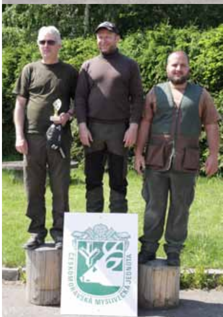
Vítězové kategorie Open.