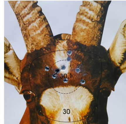
OPEN rychlopalba vleže na 150 m za 45 sec, 308W